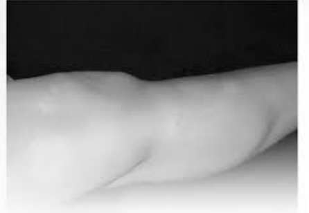
โรคกระขาวชนิดที่พบได้บ่อยในผู้สูงอายุ

รอยขาวอีกชนิดที่พบได้บ่อยโดยเฉพาะในผู้สูงอายุได้แก่ กระขาว กระขาวนี้เกิดขึ้นจากการที่ผิวหนังสัมผัสแสงแดดเป็นระยะเวลาานาน ผิวหนังจะมีลักษณะเป็นจุดหรือเป็นปื้นเล็กๆ สีขาว มักพบบริเวณที่สัมผัสแสงแดด เช่น แขนด้านนอก และคอ โรคกระขาวไม่อันตราย แต่อาจทำให้แลดูไม่สวยงาม สามารถรักษาโดยการทำเลเซอร์ และการทายาบางชนิด